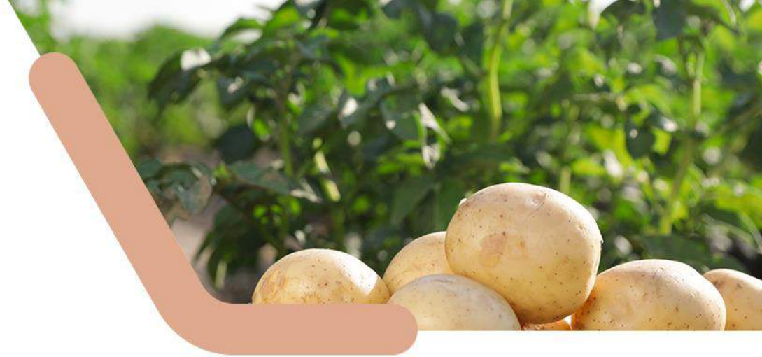
Tabela. Produção de tubérculos de batata com e sem a aplicação do BULK®, safra inverno 2020.