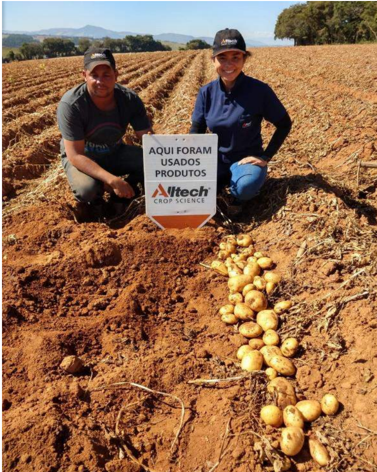
Figura. Produção e padrão dos tubérculos de batata cv. Cupido, com e sem aplicação de BULK®, em Três Corações-MG, safra inverno 2020.